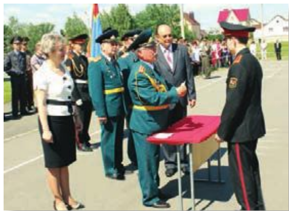
– Училище! Равняйся! Сми-и-и-рно!

На плацу единым фронтом замерли кадеты, и среди них – 43 выпускника 2014 года: в Минском областном кадетском училище состоялся 3-й выпуск.