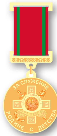
Медаль «За служение Родине с детства» I и II степени

Орден «Кадетская слава» выполнен в виде «георгиевского креста» с пучками лучей, исходящих от середины креста, на которых расположены перекрещивающиеся якорь и меч. Центральная часть ордена выполнена в виде равноконечного греческого креста. Композицию завершает круг с барельефом генералиссимуса А.В.Суворова и адмирала П.С.Нахимова. Внешнюю сторону