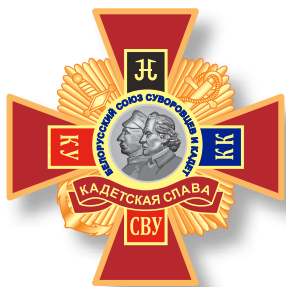
Орден «Кадетская слава» I и II степени

На итоговом заседании Республиканского совета и Совета старейшин Белорусского союза суворовцев и кадет 23 декабря 2014 года были рассмотрены проекты новых общественных наград ОО БССК. Решением Республиканского совета учрежден орден «Кадетская слава» I и II степени и медаль «За служение Родине с детства» I и II степени.