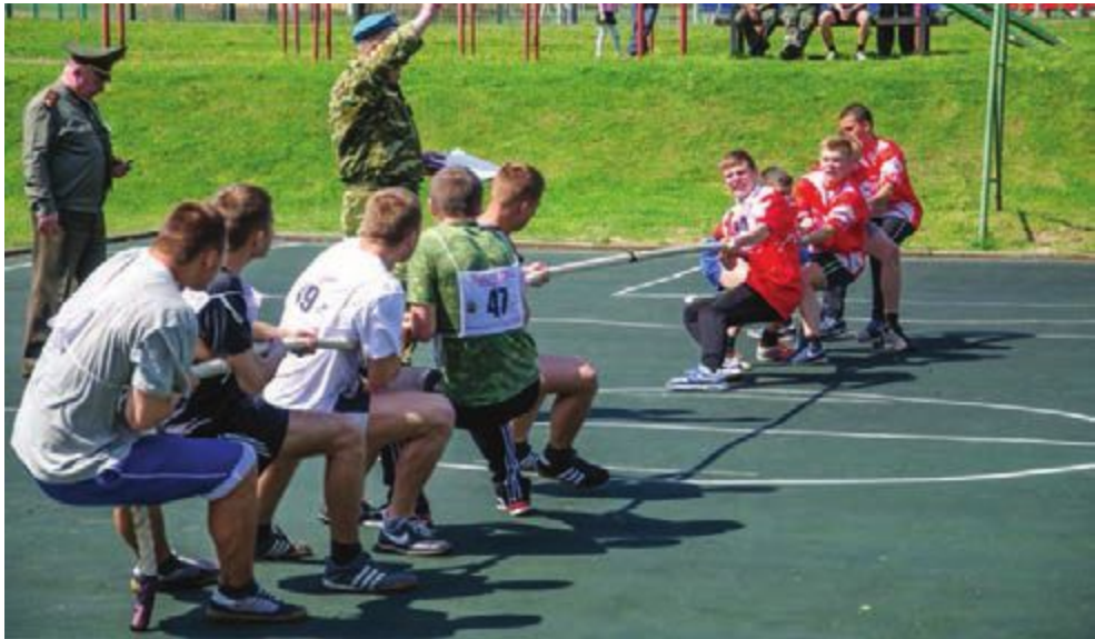
«Вдохновение» Оршанской средней школы №20 был дан концерт. Завершился этот насыщенный событиями день захватывающим огненным шоу.